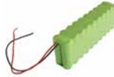
BAT M016 Batterie 24 V 1,6 Ah