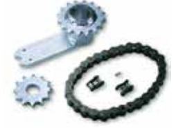
INT 360 Kit pour ouverture vantail à 360°