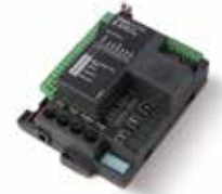
STARG8 24 Centrale de recharge 24 Vcc