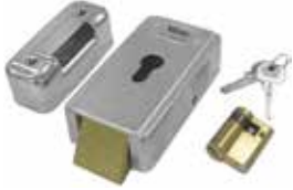
LOCK HO Serrure électrique 12 V horizontale