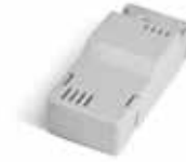
BAT K3 Carte de charge des batteries BAT M016