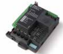
STARG8 24 Centrale di ricambio 24 Vdc