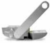
INTRO LOCK Sistema di sblocco con leva