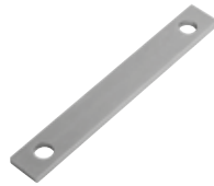
INTRO FR Adattatore per casse di fondazione