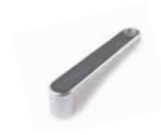
INK Leva di sblocco per INTRO LOCK (4 pz./conf)