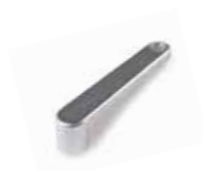
INK Sistema de desbloqueio por INTRO LOCK (4 un./emb.)