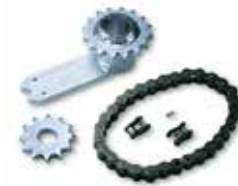
INT 360 Kit para abertura da folha a 360°