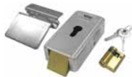
LOCK VE Fechadura elétrica vertical 12 V