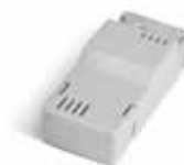
BAT K3 Placa de carga para bateria BAT M016