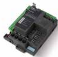
STARG8 AC Central de substituição 230 Vac