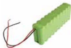
BAT M016 Bateria 24 V 1,6 Ah