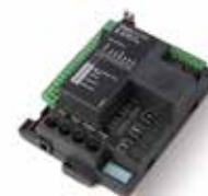
STARG8 24 Central de substituição 24 Vdc