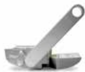
INTRO LOCK Sistema de desbloqueio por alavanca