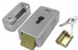
LOCK HO Fechadura elétrica horizontal 12 V