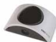
NOVO PH 180