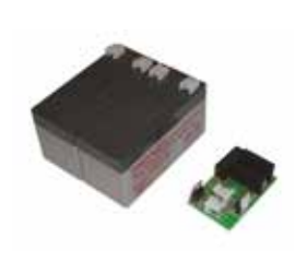
BAT 12K Batterijkit 24 V (2 x 12 V - 1,2 Ah) met connectoren en batterijplaatkaart