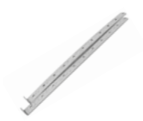
SRO 01 Aanvullende kit voor bevestiging aan plafond