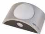
NOVO LT 24 PLUS