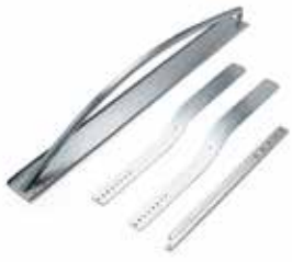
ARC 01 Zwenkarm voor kantelpoorten met tegengewichten