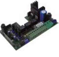
STAR GDO 100 Reservebesturingseenheden