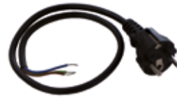
SPI 01 Voedingsstekker met snoer. Lengte 70 cm