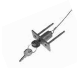
SBLO 500 Ontgrendelingsmechanisme van buitenaf. Montage via opening in poort