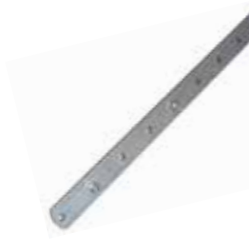
SRO 02 Verlengstuk voor sleepboog