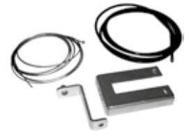
SBLO 01 Ontgrendelingsmechanisme van buitenaf. Montage op handgreep