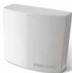
STAR B PLUS Steuerung für einen 230 Vac Motor mit eingebautem Funkempfänger